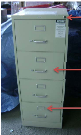
Cerradura con llave