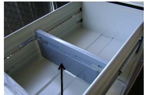
Compresor de carpetas